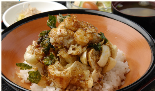
「食堂やまびこ」地元食材使用