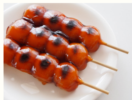
「だんごのころみや」 焼きたてだんご