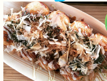
「GREEN PEACE」本場大阪たこやき