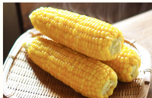
ゆできび (野外販売)